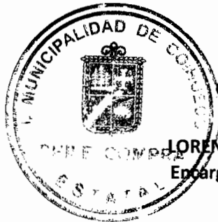
LORENA COFRE ZENTENO Encargada Chilecompras