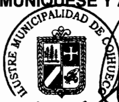
CARLOS CHANDIA ALARCÓN Alcalde de Coihueco