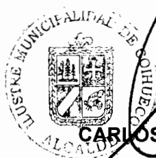
CARLOS CHANDIA ALARCON ALCALDE I. MUNICIPALIDAD DE COIHUECO