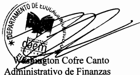
Washington Cofre Canto Administrativo de Finanzas