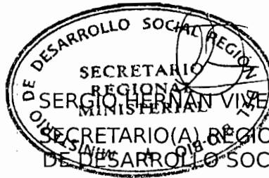
SERGIO HERNAN VIVEROS VIVEROS (S) SECRETARÍO(A) REGIONAL MINISTERIAL DE DESARROLLO SOCIAL, DEL BIO BIO