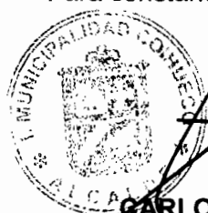
CARLOS CHANDIA ALARCON ALCALDE I. MUNICIPALIDAD DE COIHUECO