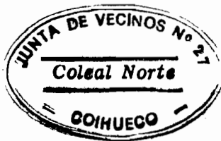
ARNOLDO JIMENEZ VENEGAS Alcalde de Coihueco