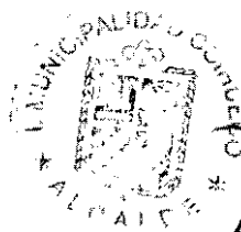
ARNOLDO JIMENEZ VENEGAS Alcalde de Coihueco