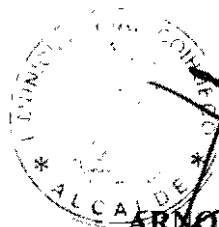
ARNOLDO JIMENEZ VENEGAS Alcalde de Coihueco